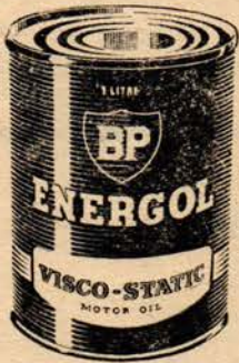
BP Energol "Visco - Static"

Arabanızdan daha iyi randıman almak için